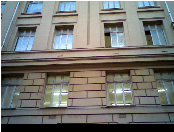
Figura 2.4 – Rilievo termografico dei serramenti

corrispondenza dei terminali di emissione quali gli elementi più disperdenti di calore in una facciata dell’edificio.