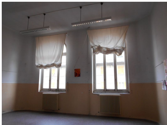
Figura 2.2 - Particolare dei serramenti