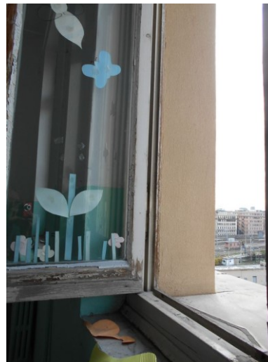
Figura 2.1 - Particolare dei serramenti