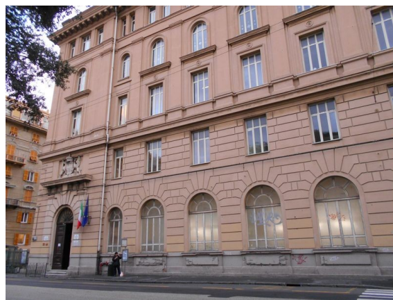
Figura 1.1 - Particolare della facciata principale

L’involucro edilizio opaco che costituisce l’edificio è composto da murature portanti costituite prevalentemente da mattoni pieni. La copertura dell’edificio è piana, costituita da blocchi di laterizio più calcestruzzo e materiale impermeabile. La struttura presenta anche esternamente un rivestimento in pietra intonacata in corrispondenza del piano terra e del primo piano. Inoltre la facciata principale presenta rivestimenti superiori delle finestre del primo piano secondo lo stile di edifici storici.